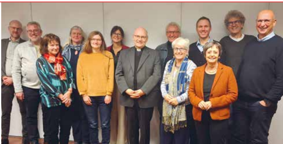
Besuch vom Bischof Dieser aus Aachen!

Unter diesem Motto beteiligte sich der Volksverein am Veilchendienstagszug. In Anspielung auf das Hochwasser vom September (Humor ist ja bekanntlich, wenn man trotzdem lachen kann) und den engagierten Wiederaufbaumaßnahmen liefen etwa 30 Mitarbeiterinnen und Mitarbeiter als Regen, Sturm und Sonne verkleidet beim närrischen Umzug mit. Neben der klaren Botschaft, den Optimismus nicht zu verlieren, war es ein großes Vergnügen für die Beteiligten. Übrigens: Die Kostüme waren ausschließlich aus gespendeten Secondhand-Artikeln hergestellt (Upcycling) und statt Kamelle wurden ebenfalls Secondhand-Artikel verteilt. |