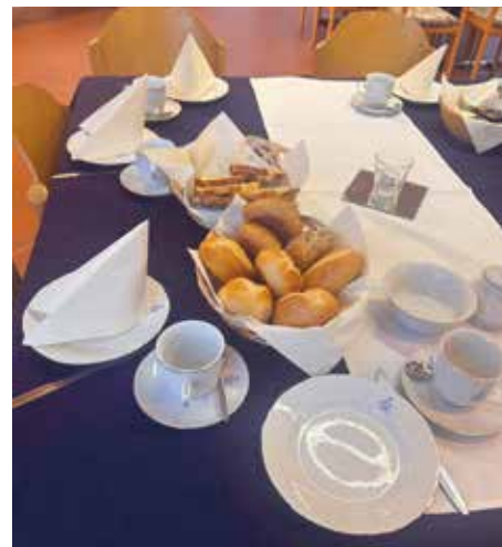
Beerdigungskaffee ist auch Seelsorge.

Das Team ergänzt sich – Erfahrung, Organisation und praktische Unterstützung greifen ineinander. So wird