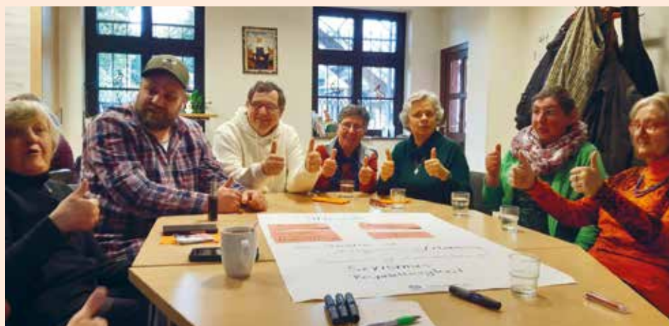
Wer hier ist, wird nicht gefragt, woher er kommt.

Wir als Steyler Missionsschwestern leben aus der Bitte um den Heiligen Geist – aus der Kraft Gottes, die uns untereinander verbindet. Diese lebensspendende Verbundenheit wird für mich besonders in ehrlichen Begegnungen spürbar. Im TaK erlebe ich immer wieder solche Augenblicke. Und oft sind es genau diese Gespräche, in denen ich mich Gott ganz nah fühle. |