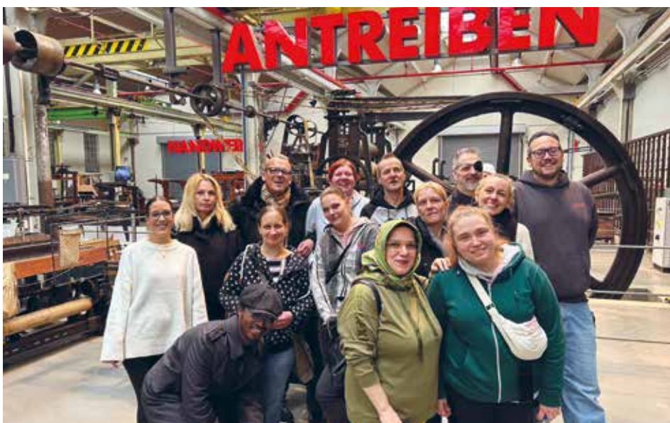
Textilexpert*innen erkunden die Textilgeschichte.