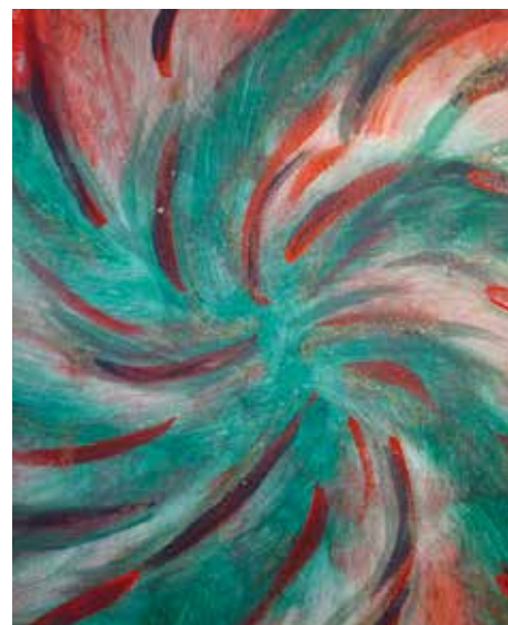
Den Blick schärfen – draußen im Theater oder vertieft in Farbe und Papier.