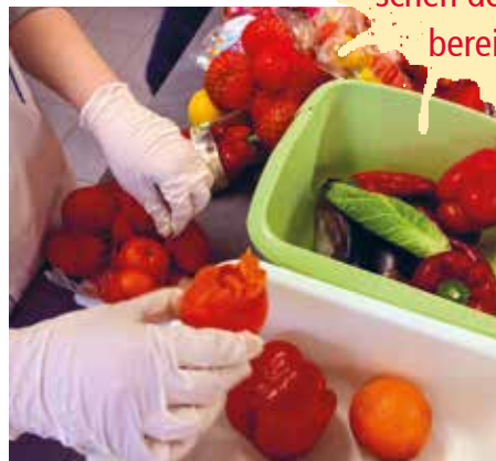
Lebensmittel retten ist eine verantwortungsvolle Arbeit.