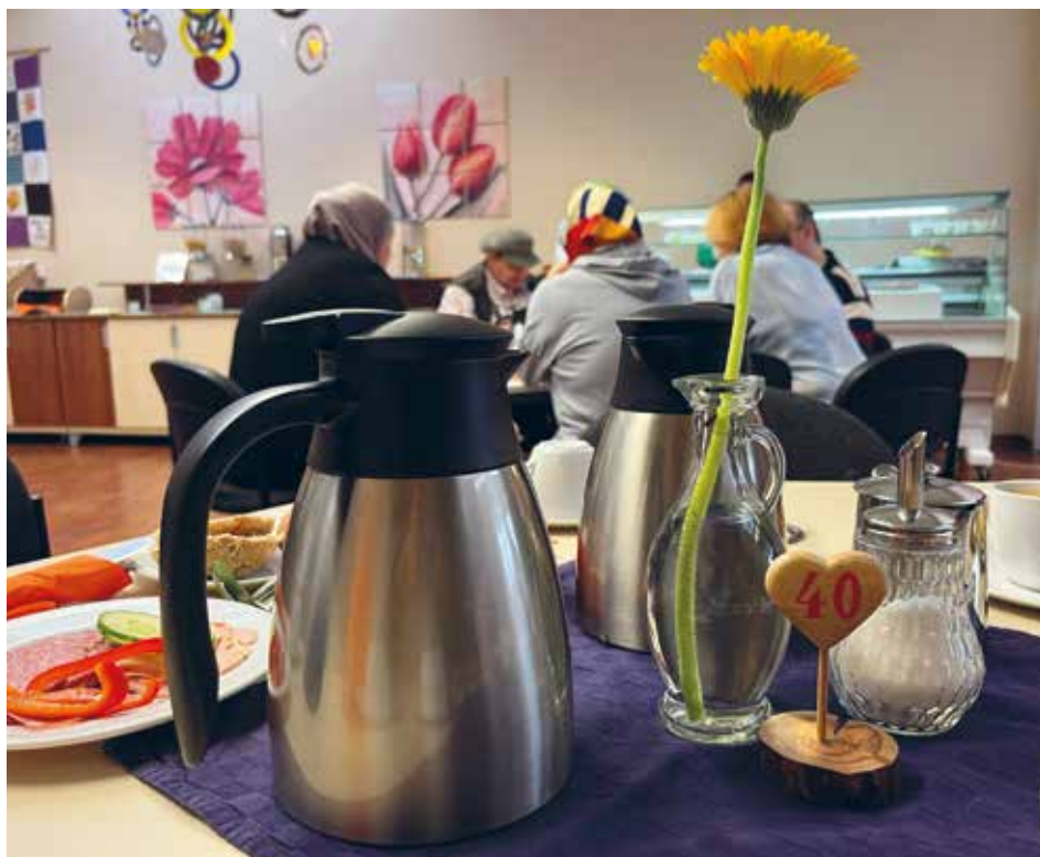
Das wöchentliche Frühstück ist ein zentraler Ort der Begegnung.

Menschen erleben Wertschätzung: Man ist eingeladen. In der Gemeinschaft des Volksvereins zählt der Mensch, nicht sein Status auf dem Arbeitsmarkt.