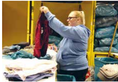
Von der Sortierung bis zu den Shops gehen alle Stücke durch viele prüfende Hände.

Auch an unserer Spendenannahme entstehen besondere Momente. Wer Kleidung oder Haushaltswaren abgibt, gibt oft mehr als nur Dinge weiter. In jeder Tüte steckt eine Geschichte: das Kleid, das auf einer Feier getragen wurde, die Jacke, die ein Kind durch mehrere Winter begleitet hat. Die Begegnung zwischen Spenderinnen und Spendern und unseren Mitarbeitenden ist geprägt von Vertrauen. Manchmal erzählen die Menschen, warum sie gerade jetzt spenden. Manchmal geht alles ganz schnell – ein freundlicher Gruß, ein kurzer Austausch, ein Dankeschön. Doch selbst